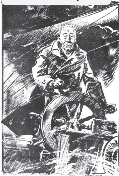
Bron 10 Stuurman Colijn in 1936

In deze opdracht beoordeel je informatie kritisch. Zie vaardigheid 4.